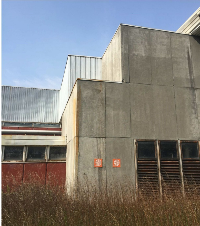
Figura 9 - VISTA 6