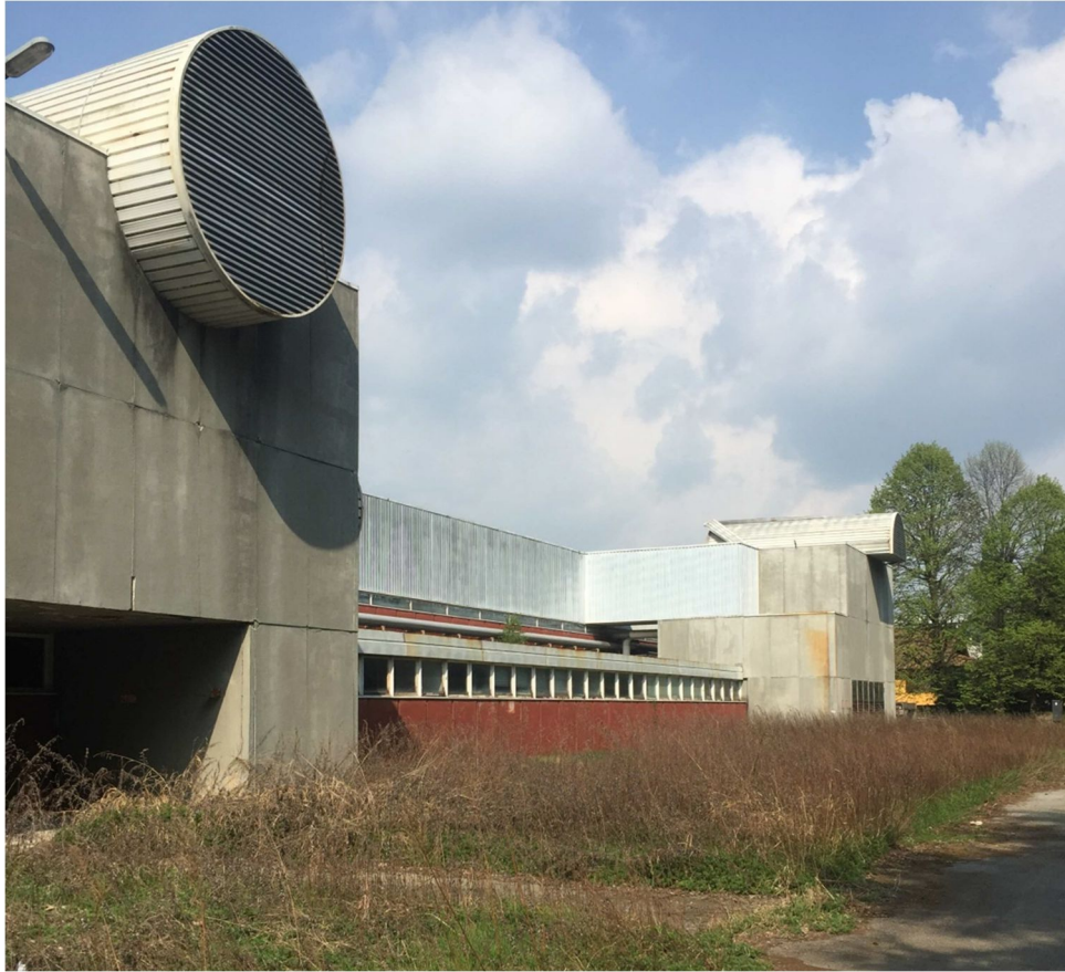
Figura 13 - VISTA 10