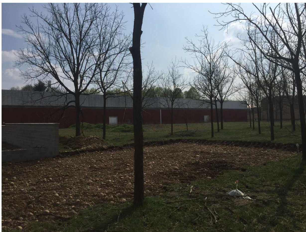
Figura 4 - VISTA 17