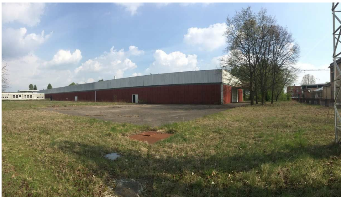
Figura 3 - VISTA 1