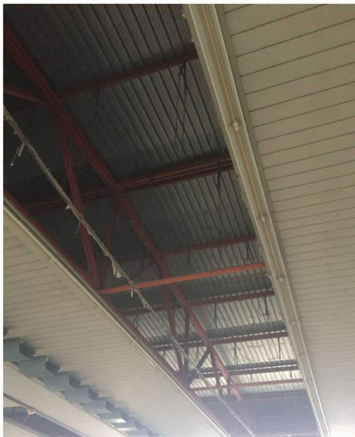
Figura 19 -VISTA 16