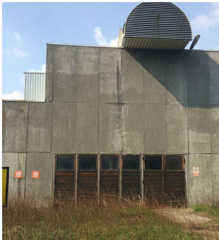
Figura 8 - VISTA 5