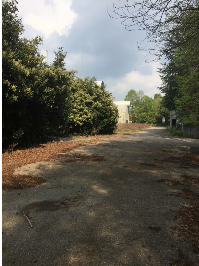
Figura 5 -VISTA 2