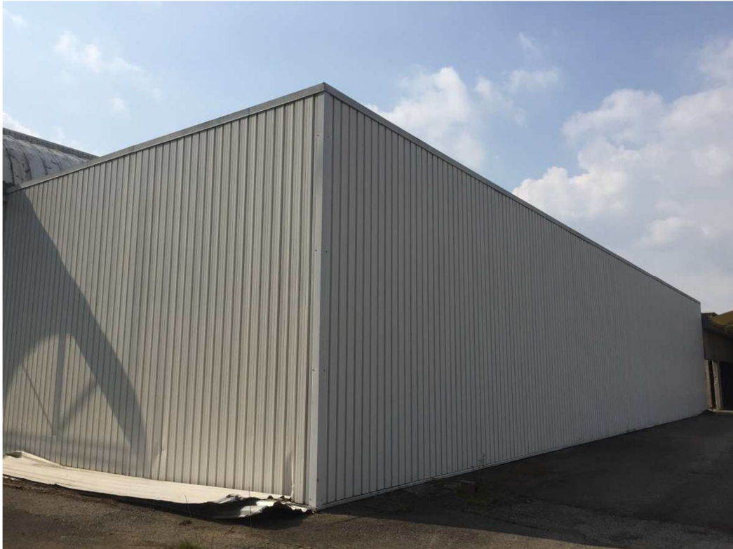
Figura 6 - VISTA 3