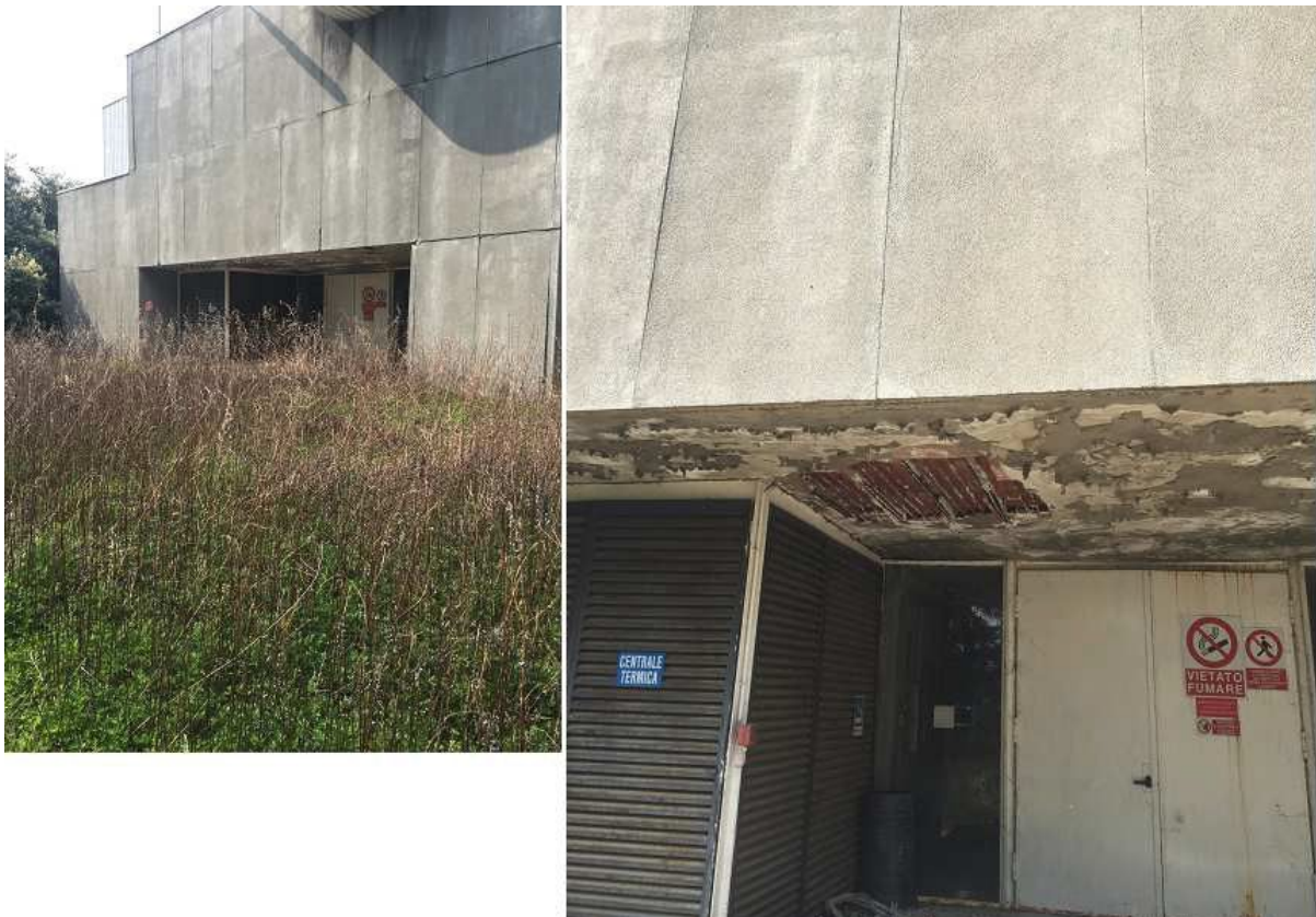
Figura 12 - VISTA 9 con dettaglio