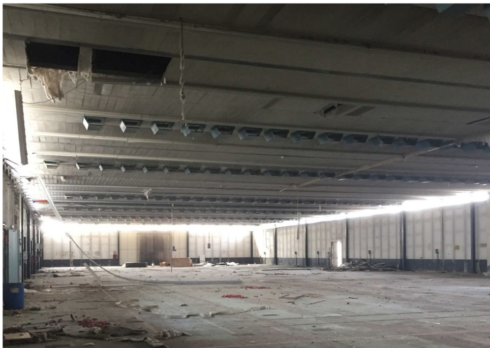
Figura 16 - VISTA 13