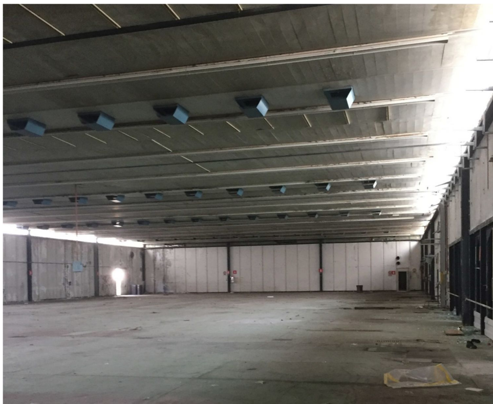
Figura 17 - VISTA 14