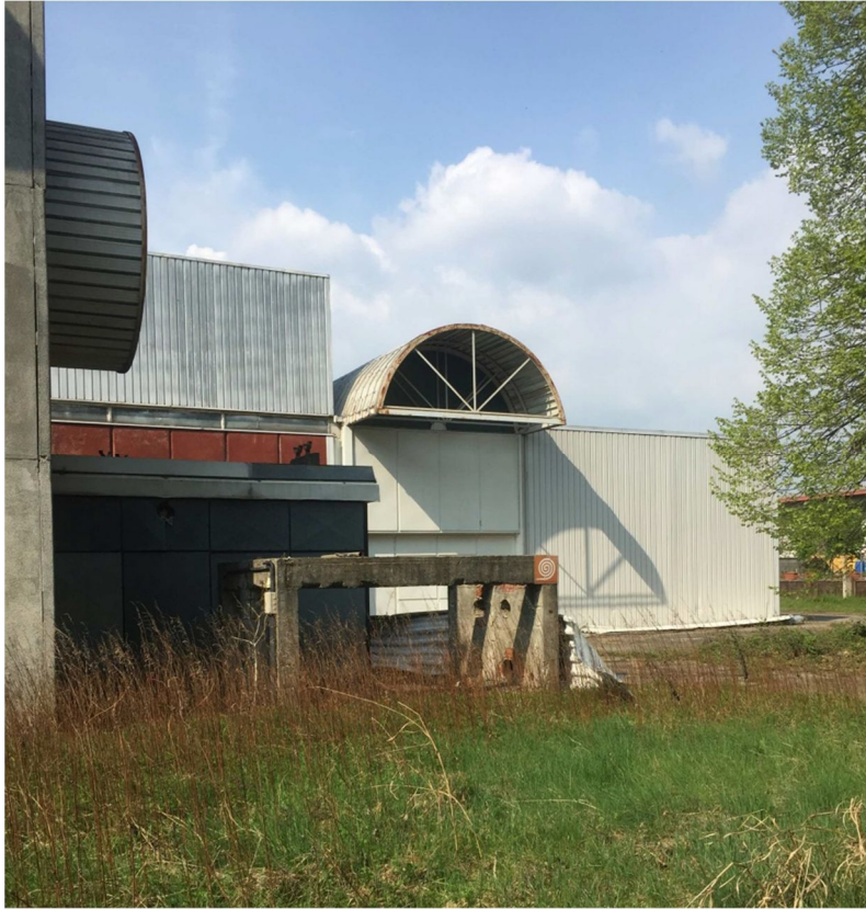
Figura 7 - VISTA 4