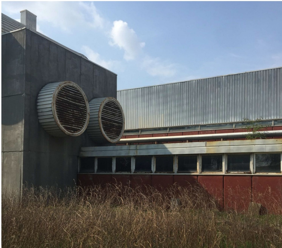
Figura 11 - VISTA 8