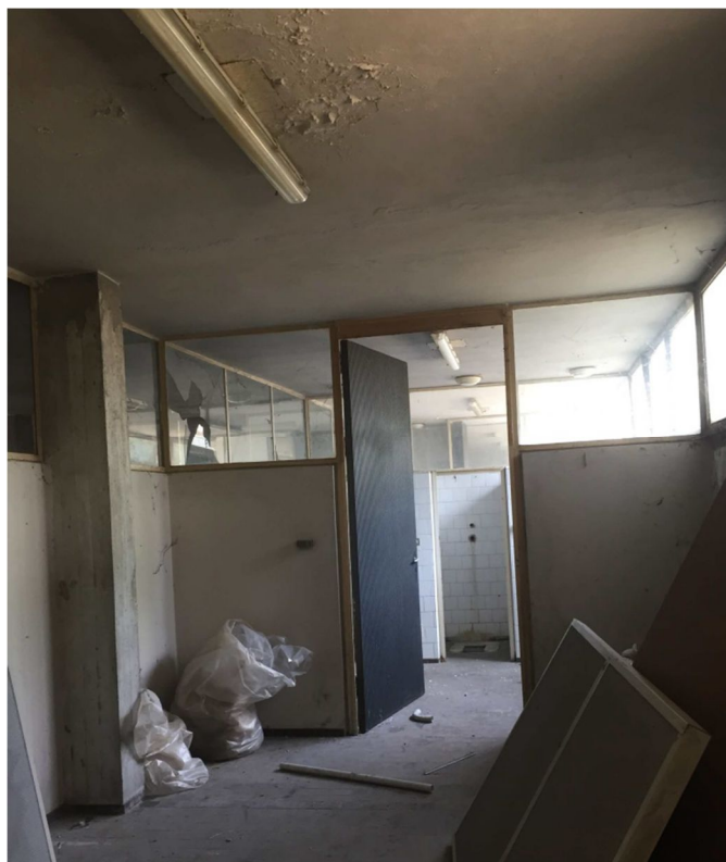
Figura 18 - VISTA 15