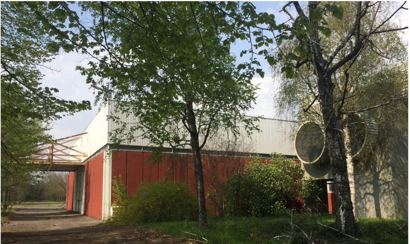
Figura 15 - VISTA 12