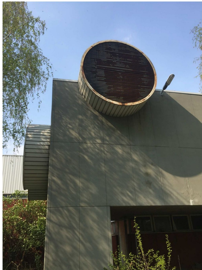
Figura 14 - VISTA 11